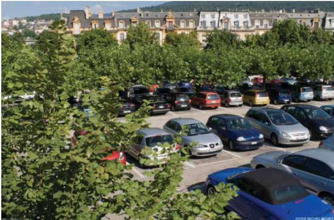
Parking dans le site de projet, zone à requalifier