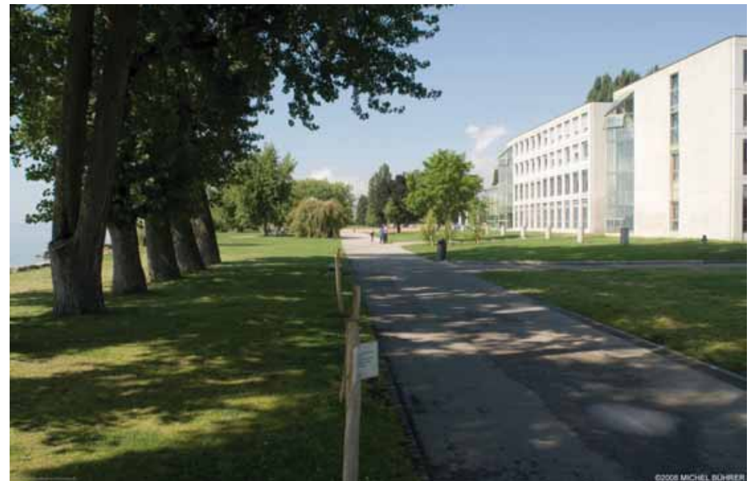
Promenade longeant le site de projet avec le Lac à gauche