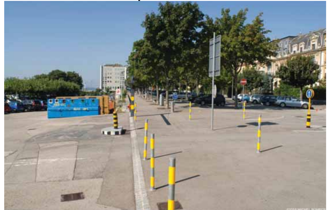
Limite du site de projet et quartiers d'habitations