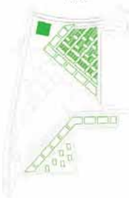
1 er Etape