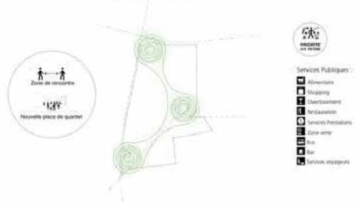
Identification du vide public

- Comment affirmer une forme urbaine conditionnée par les étapes du démantèlement de l'activité industrielle ?