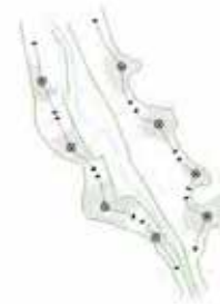
Développement des périphéries