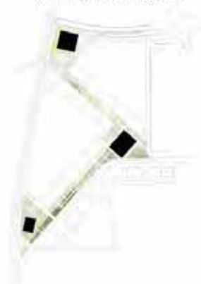
Continuum public entre trois pôles

Le projet a pour but de proposer un quartier dense, d'assumer les tracés et bâtiments existants, supports d'une identité locale, pour créer un dispositif public fort et fonctionnel, qui pourrait supporter tout scénario de densification résidentielle sans être compromis.