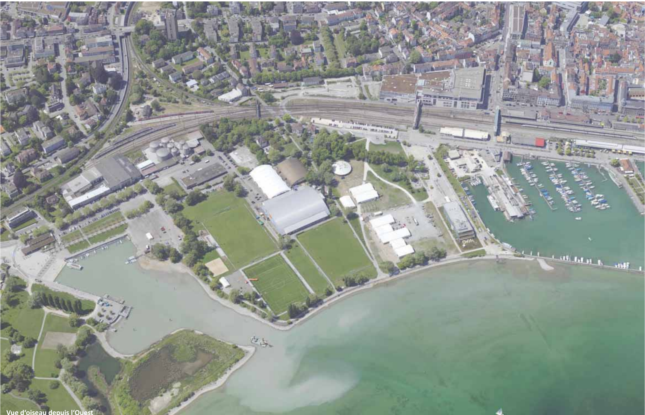
Vue d'oiseau depuis l'Ouest