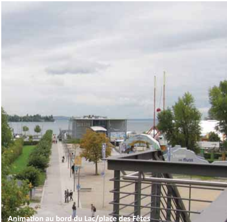
Animation au bord du Lac/place des Fêtes