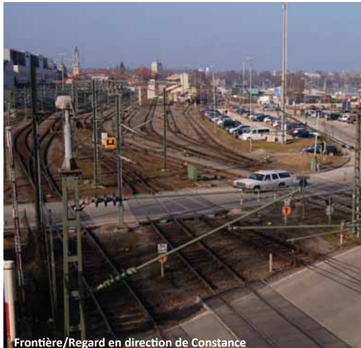
Frontière/Regard en direction de Constance