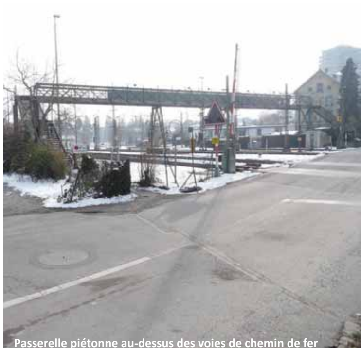
Passerelle piétonne au-dessus des voies de chemin de fer