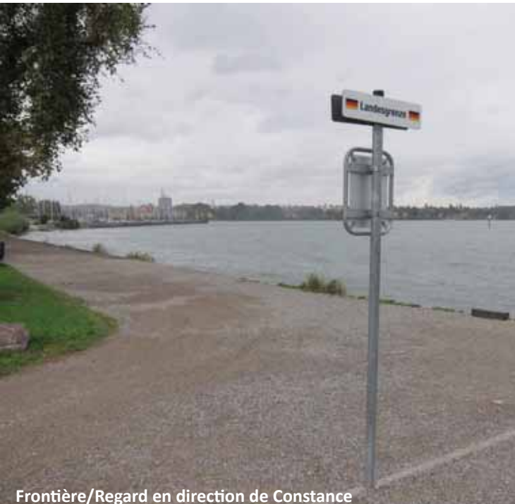
Frontière/Regard en direction de Constance