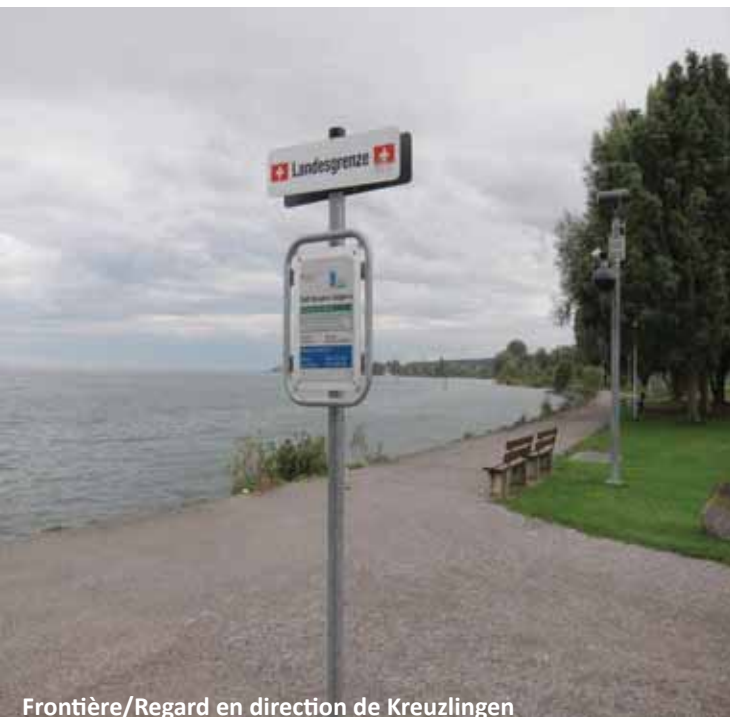
Frontière/Regard en direction de Kreuzlingen