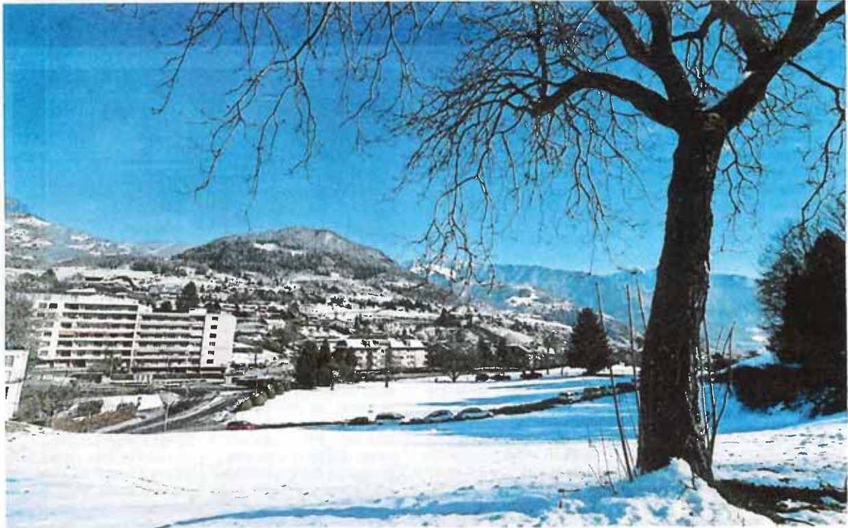
Le tracé du chemin des Leppes (ici avec des voitures parquées) sera modifié et sinuera entre les immeubles en projet. CHANTAL DERVEY